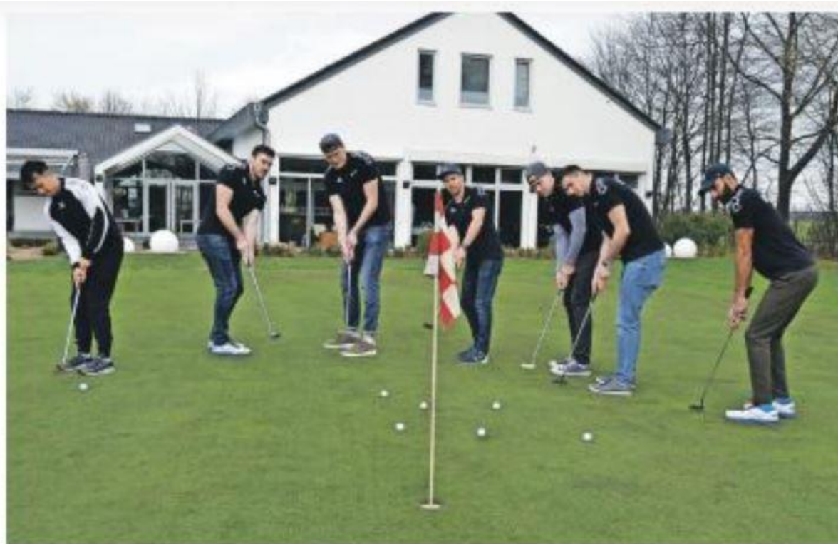
Am Putter so stark wie am Netz erwiesen sich die Spieler SWD Powervolleys beim Vorbesuch zum Tag der offenen Tür im Golfclub Düren.