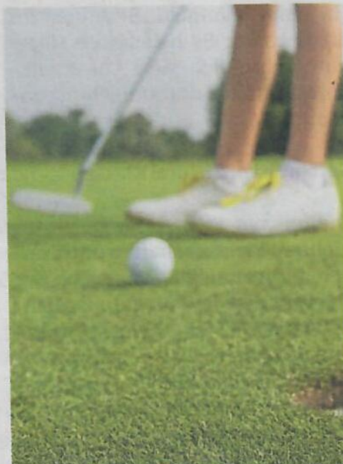
In Düren wurde für den guten Zweck gespielt.

Weitere Informationen zu den bundesweiten Golf-Wettspielen, zur Deutschen Krebshilfe und zum Thema Krebs gibt es unter der Telefonnummer 0228/729900 und im Internet unter www.krebshilfe.de .